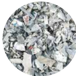
Aluminium : séparation des alliages