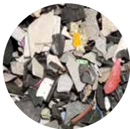
DEEE : élimination du chlore ou du plastique bromé