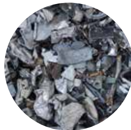
Zorba : nettoyage de l'aluminium (Twitch)