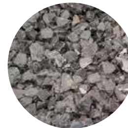
Verre : suppression du verre plombé